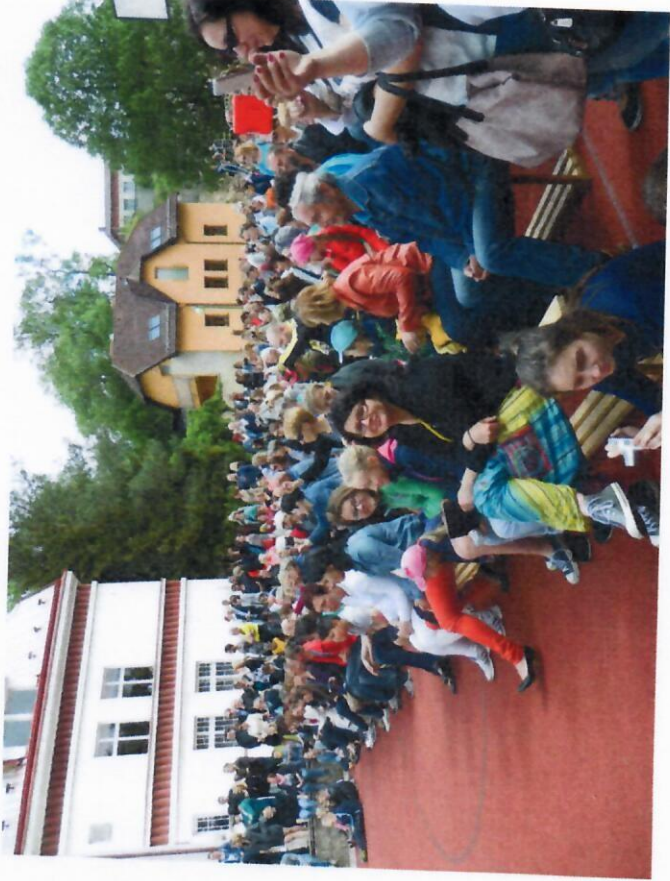
90. výročí založení školy