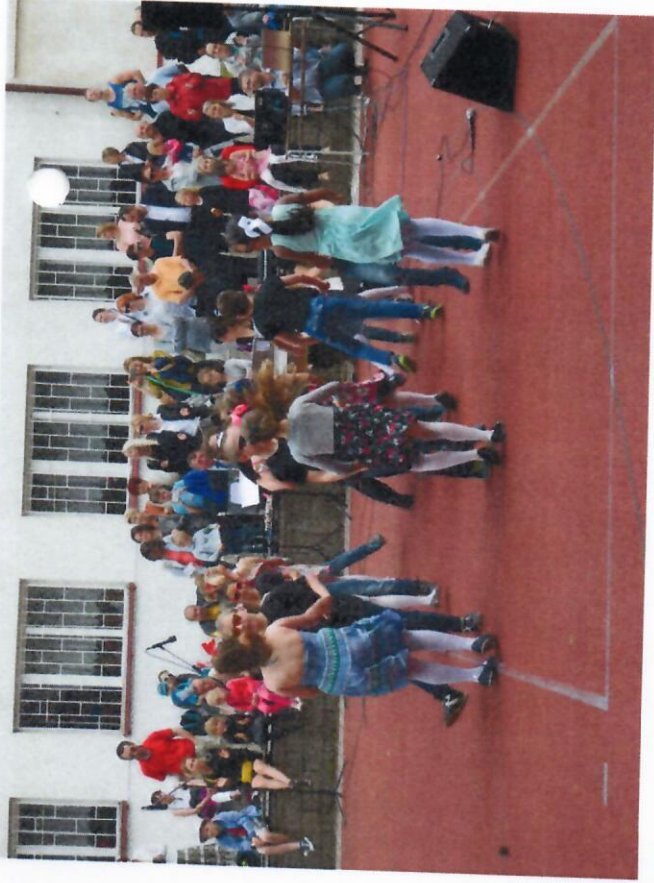
90. výročí založení školy