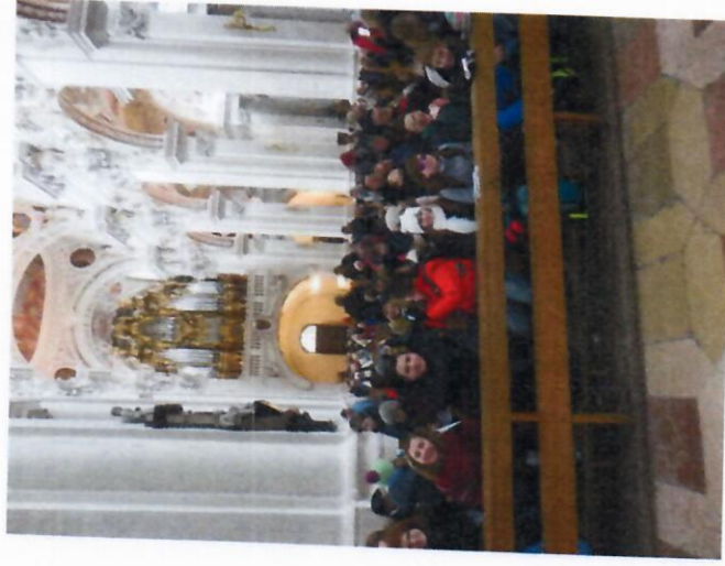
Zájezd do Pasova - prosinec 2016