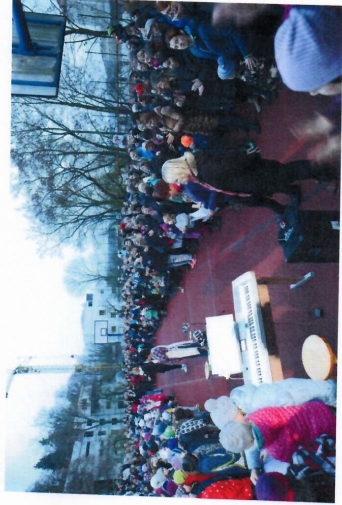
Vánoční jarmark - listopad 2016