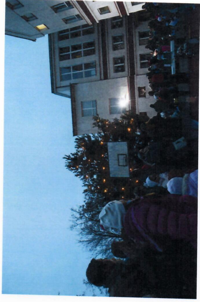
Vánoční jarmark - listopad 2016