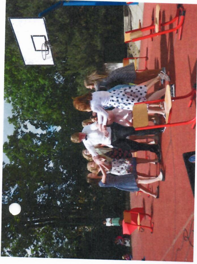
90. výročí založení školy