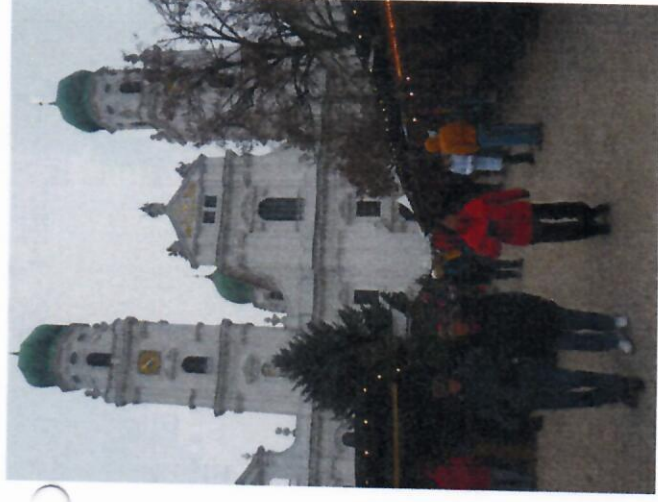
Zájezd do Pasova - prosinec 2016