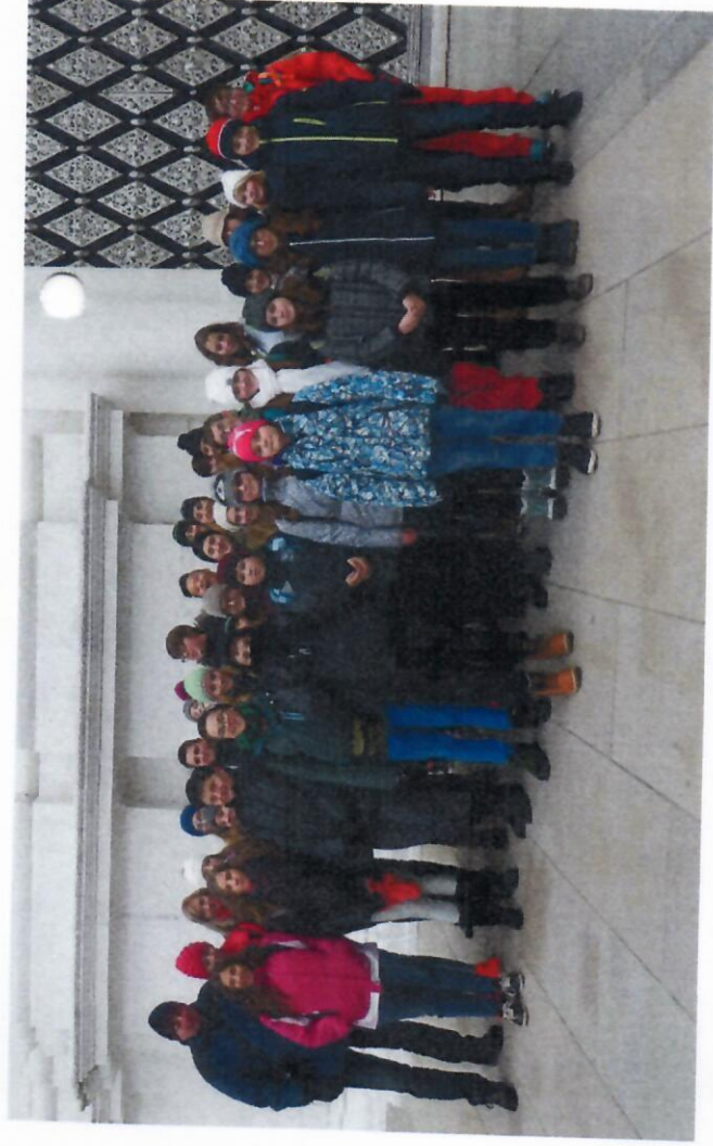
Zájezd do Pasova - prosinec 2016