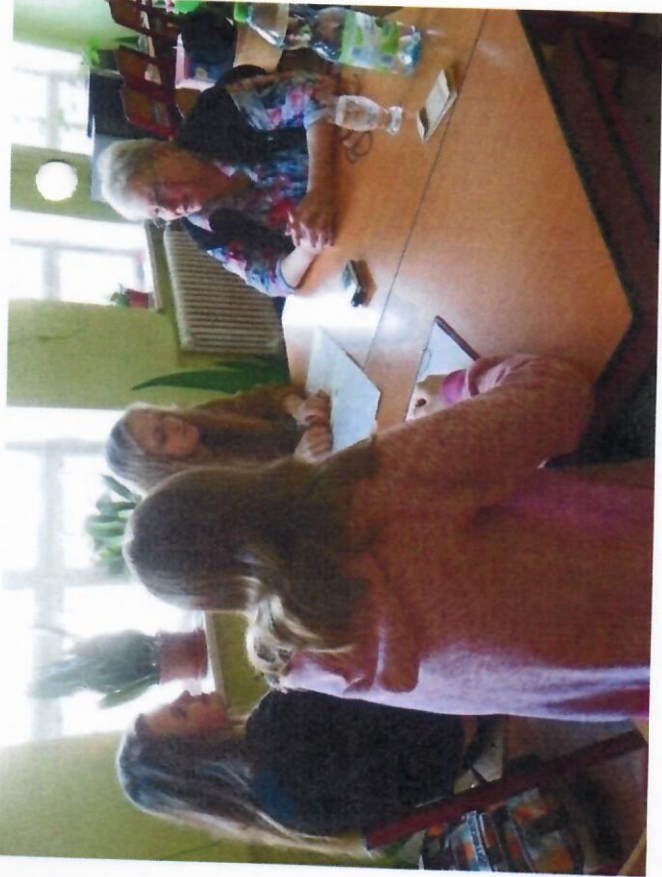
Příběhy našich sousedů