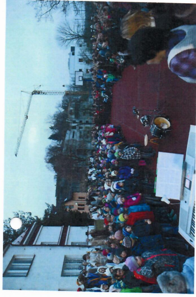
Vánoční jarmark - listopad 2016