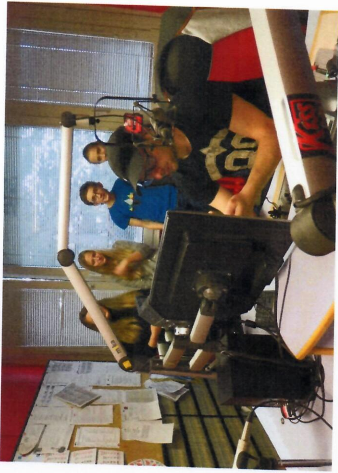
Příběhy našich sousedů