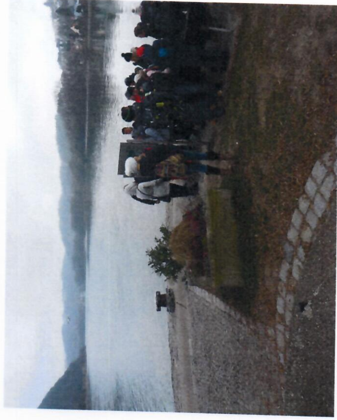
Zájezd do Pasova - prosinec 2016