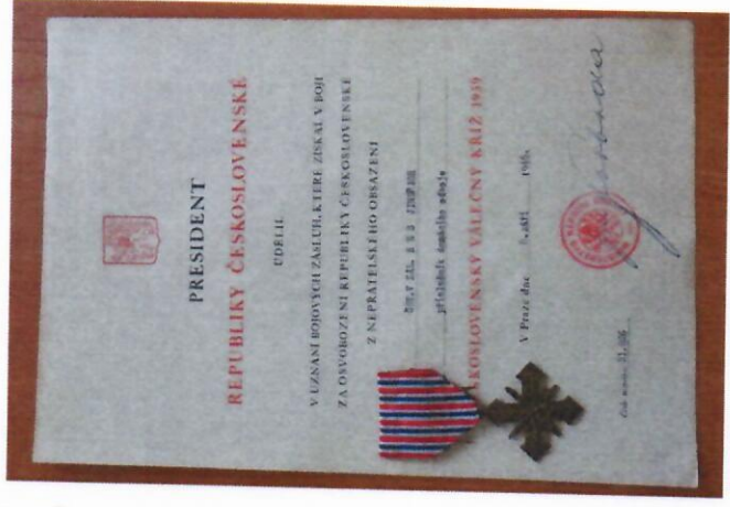
Příběhy našich sousedů