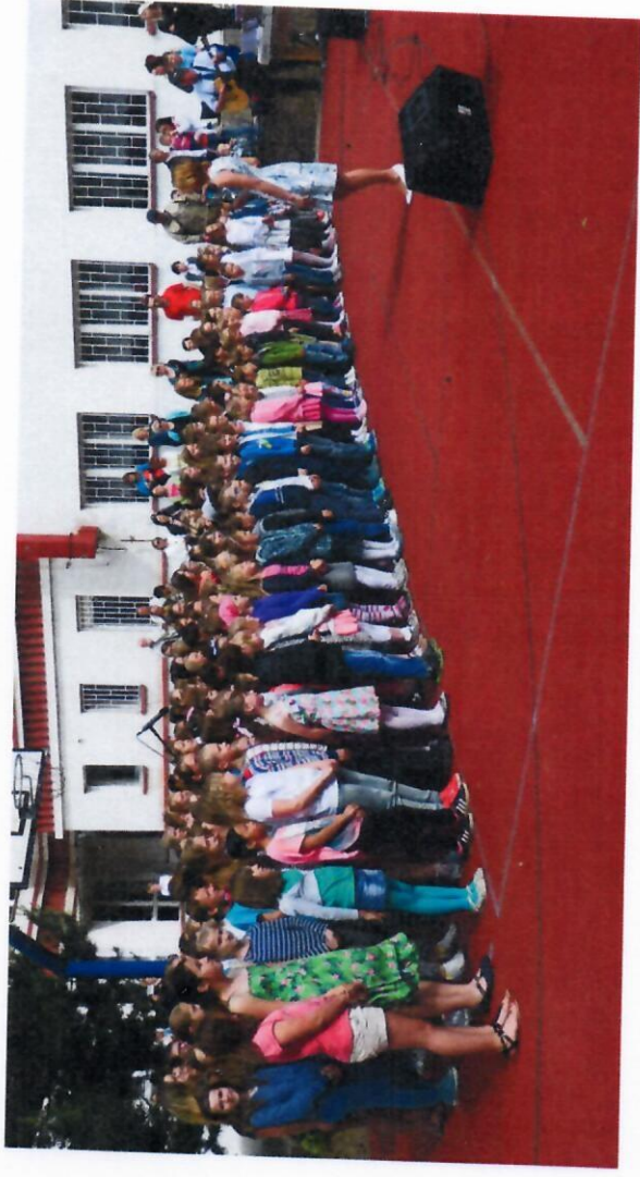
90. výročí založení školy