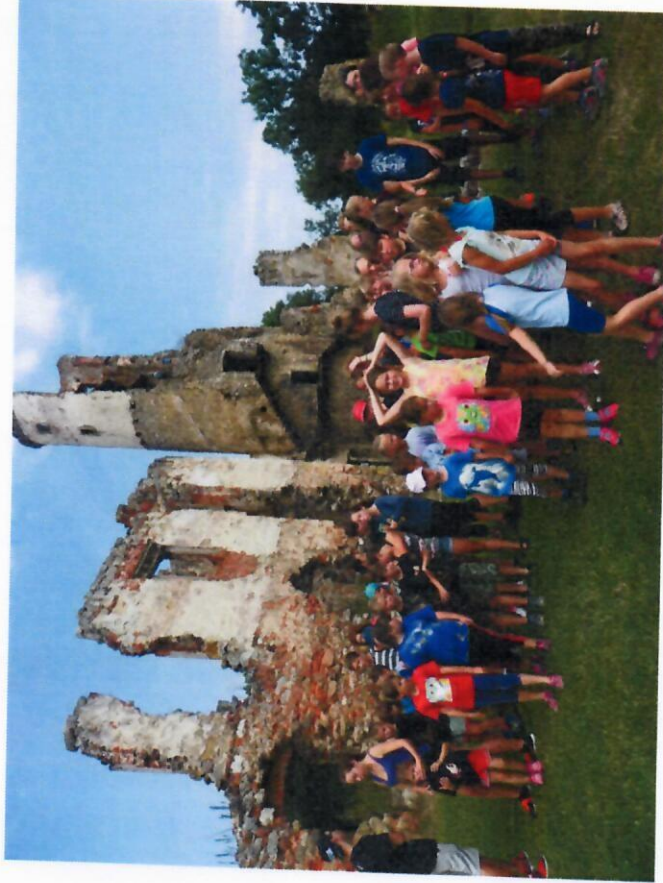
Příměstský tábor červenec 2017