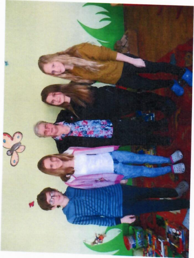
Příběhy našich sousedů