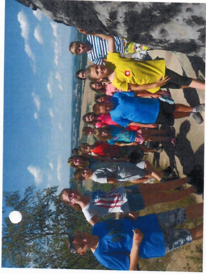
Příměstský tábor červenec 2017