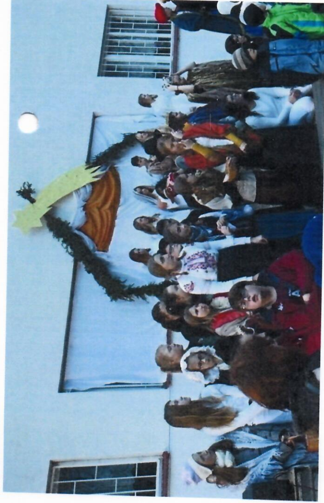
Vánoční jarmark - listopad 2016